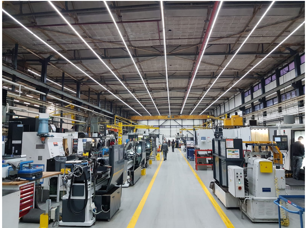
Foto: Een DATA LUX.LT lijnverlichtingsstelsel wordt gebruikt bij de re-lichting van een complexe productieomgeving. De gebruiker is verzekerd van functionaliteit en kan in de toekomst de armaturen laten upgraden. Door het plug-and-play principe kunnen deze lijnen eenvoudig herplaatst worden, zonder dat onderdelen beschadigen.

Als producent van energiezuinige verlichtingsystemen die lang mee gaat denkt LUMINAID na over de invloed van de geproduceerde producten op onze leefomgeving. We dragen bij aan een samenleving waarin zo min mogelijk afval wordt gecreëerd en een optimaal behoud van grondstoffen wordt bewerkstelligd. Zo werken we aan het opzetten van een economisch systeem waarbij economische groei is losgekoppeld van het groeiend gebruik van natuurlijke, eindige grondstoffen.